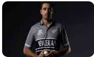
न्युजिल्याण्डका तिर गतिका बलर टिम साउथी टो-ट्वान्टी अन्तराष्ट्रियमा सर्वाधिक विकेट लिने खेलाडीको शीर्ष स्थानमा उभिएका छन् । हसनले १ सय ४ खेलमा १ सय २२ विकेट लिएका छन्