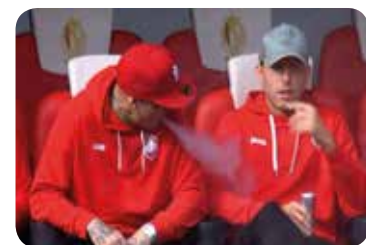
बेल्जियन मिडफिल्डर राज्जा नाइनगोलान बेल्जियन लिग अन्तर्गत खेलअघि बेन्चमी भेष (इ-सिगरेट) तानेपछि निलम्बनमा परेका छन् । सो घटनापछि उनलाई अनिश्चित समयका लागि निलम्बन गरेको बताएको छ